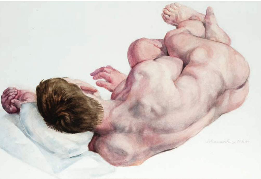
Peter Schauwecker, Gerd

Vanuit welk achterliggend idee ben je model geworden? Want model staan is niet gemakkelijk en wordt vaak onderschat. Je moet er een goed lichaam voor hebben, maar moet ook lang in een bepaalde houding kunnen blijven staan.