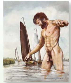
'IN REUS FOAR IT SKÛTSJE FAN GROU'